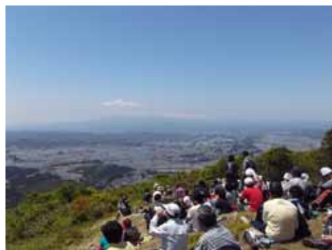
昨年のニッ森登山の様子